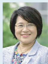
高橋 都 議員 (30分)