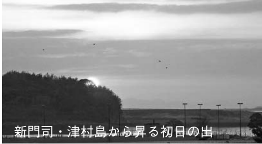
新門司・津村島から昇る初日の出