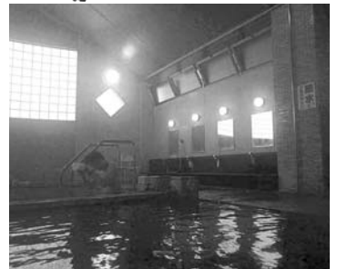
こちらが不老泉の正しい写真です。まあ大概の方は気にも留めなかったでしょうが。

2017年が始まりましたが、皆様、幸先の良いスタートを切ることが出来ましたでしょうか。ワシは成人式の三連休で温泉に出かける予定が流感で寝込んでしまいました。おかげで来月号をどうしようかと気を揉んでおります。