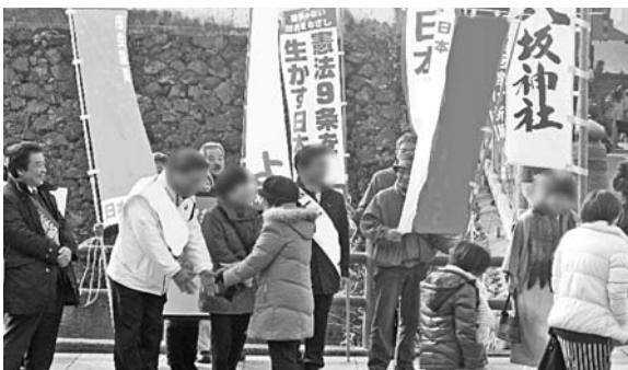
元日の八坂神社で参拝者に挨拶する予定候補

北九州市の借金（市債）総額は15年度で1兆4000億円に迫ろうとしています。その借金の多くは●黒崎コムシテイ●AIMビル●メディアアドーム●ひびきコンテナターミナルなどの箱モノ大型事業です。