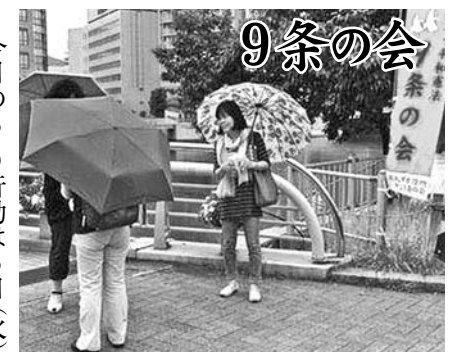
今月の6・9行動は6日（火） の夕方、小倉の鵜外橋横で行 いました◆この日から北部九 州地方も梅雨入り。ばらばら と雨も降りはじめましたが、 先月に続き今月も「雨にもめ げず」行動しました◆5月22 日には「核兵器禁止条約」の 草案も発表されました。そ 中には「ヒロシマ、ナガサキ のヒバクシャや核実験の被害 者に思いをよせ・・・」とい う文言も組み込まれています。 この条約の実現をヒバクシャ の方は切望しています。◆短 時間の行動ではありましたが、 福島で除染作業に従事してい たという男性など3名が署名 して下さいました◆来月は6 日（木）夕方に黒崎駅前で行 う予定です。

法の施行は20年4月からと なっており、法案の附帯決議 に示されている「常勤職員に よる公務運営の原則、不利益 のない適正な勤務条件、財源 の確保」などを速やかに履行 させる取組がこれからの課題 です。（終わり）