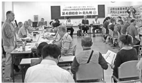
総会では活発に意見が出されました

一昨年、沖繩県は土砂条例をつくりました。県外から沖繩に土砂を持ち込む場合は、90日前に沖繩県に知らせ、沖繩県が特定外来生物等が含まれていないことを確認しなければ、土砂を持ち込めないとした条例です。しかし、特定外来生物が含まれていないか、大量の土砂を調べる