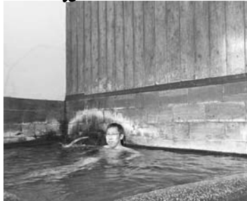
奥の塩ビパイプは打たせ湯だそう です。時折、塩ビパイプが隠れる くらい湧き出します。