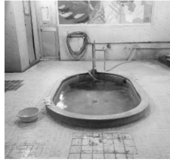
中央に小判型の浴槽

いはしない。浜脇温泉の由来は、昔ここは浜辺で、砂を掘ると湯がわくとのことで浜で湯が沸く、浜でわく、はまわくが言いにくいので、浜脇という名前になった」とのこと。「88湯めぐりでこの温泉に入りに来ました」と話をすると、「最近はそのういう人たちが増えたな」と言っていました。地元のお爺さんと交流しながらポカポカになり、東町温泉を後にしました。