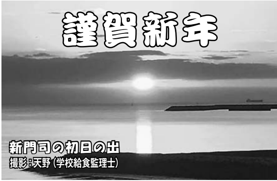
新門司の初日の出

自治労連北九州市職員労働組合 編集発行 重野 幸介 北九州市小倉北区城内1番1号 TEL 093-582-4181 FAX 093-582-4183 Eメール jhokuq@jhokuq.jp