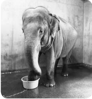
右前足を薬につけているゾウ

例えばゾウは最近、足の爪の病気に罹患しました。土壌の環境や運動量などが密接に関係していると思われませんが、野生のゾウではあまり見られないといわれている症例です。おそらく野生下での多岐にわたる生息環境と運動量から発症しづらいのかもしれない。