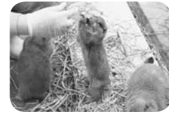
栄養補給を受けるプレーリー

この状態は放置すれば重篤な状態にもなりかねないため、動物園では対処療法としての病気のケアをすることになります。