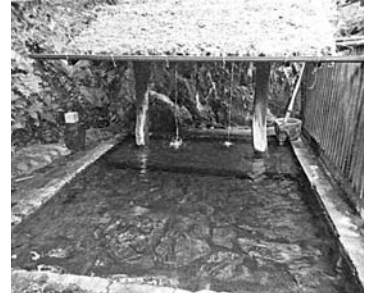
おたべにくたは実には湯に打たせ たがしんが写ってま せんでした ので脱衣所から取り直し。

前号の川底温泉に浸かる前に赤川荘、筋湯とハシゴしとつたのですが、その際、筋湯でやっと岩ん湯に浸かることが出来ましたばい。