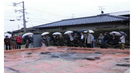
雨中の重留遺跡を見学する准教授と参加者