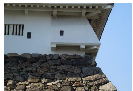
小倉城天守閣の石落とし

★参加希望の方は、資料の準備等ありますので、4月12日(金)までにお申し込みください。詳しくは同封の「案内チラシ」をご覧ください。