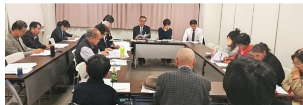
北九州市社会保障推進協議会（北九州社保協） 北九州市保護課と懇談

※ポイント還元するのは9カ月間だけです。 安倍内閣は、景気対策をしていますが、消費税10%中止が一番の景気対策です。