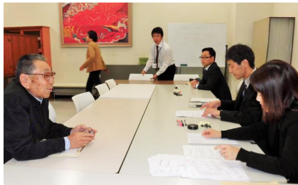
福岡県に「審査請求書」提出の趣旨を説明する、小倉生健会の毛利副会長（左）