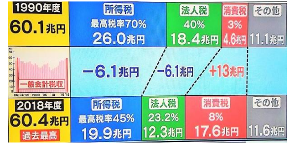
KBC「羽鳥慎一モーニングショー」より

消費税が導入される時、「小さく産んで大きく育てる」と批判されましたが、その通りになりました。 右の図、28 年前と税収は同じでも、負担割合は大企業・大金持ちが減り、国民負担が大幅に増えました。 ○所得税：最高税率が 70% から 45% へ。大金持ちの税率が減りました。 ○法人税：税率も減りましたが、大企業の多くは優遇税制などで、中小企業の税率 18% よりも低い実質 10% です。 ○消費税は見てのとおり大幅増です。