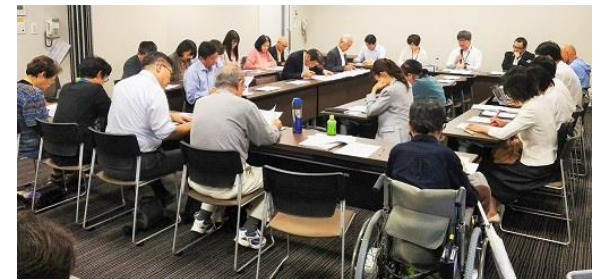
市保護課と社保協が懇談(約30人が参加)10月25日

市保護課と年に一度、生活保護について、懇談も行っています。今回は、介護保険の関係者も沢山参加し様々な課題について議論しました。