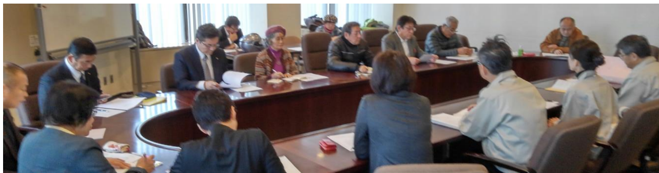
北九州市への要請行動。当局5名・市議会議員6名・当会6名・マスコミ2名