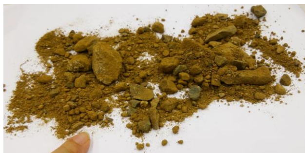
左…荷台に乗せた石材を洗っている所。右…岩ズリ。下に見えるのは指。