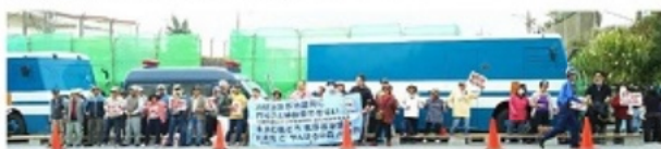
キャンパスショップの工事車両入口にて