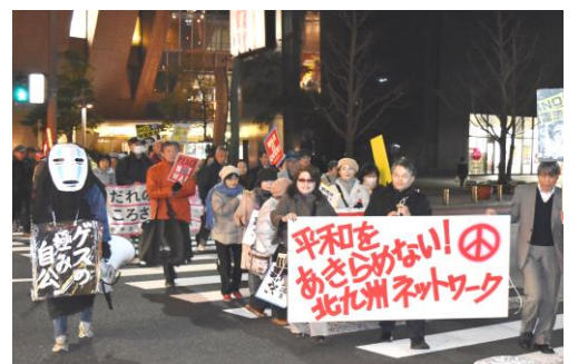
「戦争法の廃止を求める集会・デモ行進」に350人が参加 集会終了後小倉駅前までデモ行進

今国会で安倍首相は、「国民不在」「憲法無視」の姿勢をいっそう明確にし、暴走を加速しています。いま安倍首相は、「緊急事態条項」創設のための改憲を繰り返して強調しています。 この「緊急事態条項」は、「武力攻撃」が起きると首相が「緊急事態の宣言」を発し、首相の権限強化や国民の権利を制限させる危険極まりない条項です。