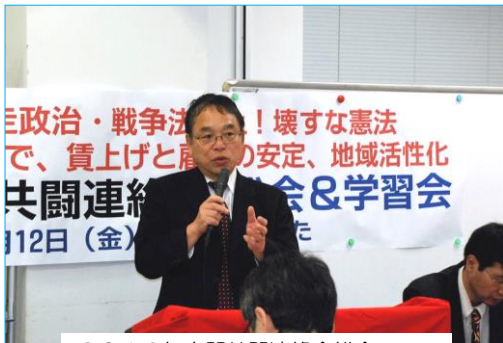
2016年春闘共闘連絡会総会で基調講演をする全労連小田川議長