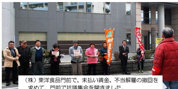
(株)東洋食品門前で、未払い賃金、不当解雇の撤回を求めて、門前で抗議集会を開きました。