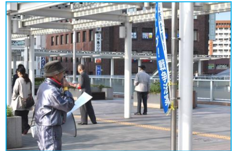
4・19メーデーチラシを配布しました

メーデー集会の成功に向けて、4月19日に門司・小倉・戸畑・黒崎の4駅で宣伝行動を実施し、マイク宣伝・チラシ配布を行いました。26日には第4回実行委員会を開催し、最後の確認を行いメーデーの成功をめざします。加盟組合のOBや家族ぐるみでの参加をお待ちしています。