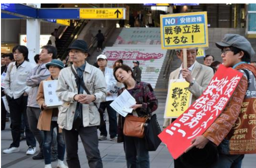
4・19小倉駅前集会&宣伝行動

4・19平和をあきらめない北九州ネット集会・宣伝行動 平和をあきらめない北九州ネットが呼びかけて、戦争法の廃止を求める宣伝及びアピール集会に多くの労働者・市民が参加しました。熊本大地震被災者救援資金の訴えも行い、多くの義捐金が寄せられました。政党からは共産党と社民党が参加しました。