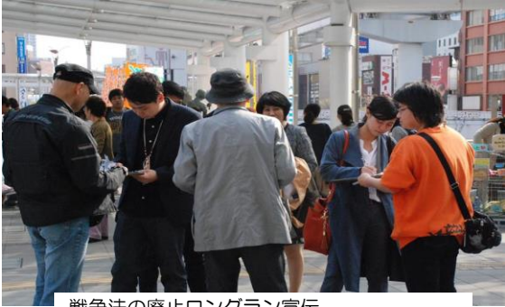
戦争法の廃止ロングラン宣伝 15時から北九州地区労連が担当しました。