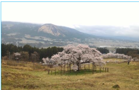
勇壮な山をバックに咲く桜（観音桜）

人間より長く生きているものは、もしかすると人間より遥かに高い知能を持っているのかもしれないね。