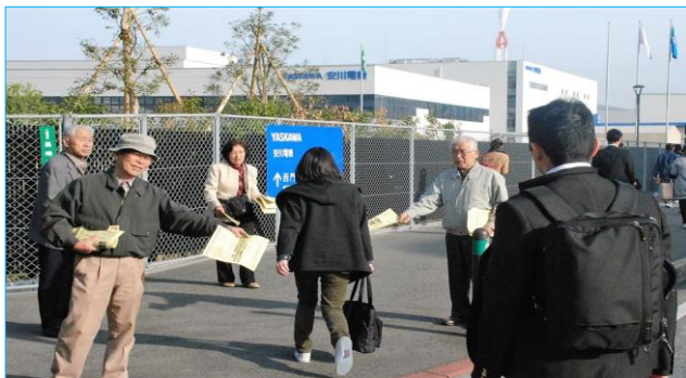
安川電機門前でのチラシ配布とマイク宣伝

解雇・残業代未払い・パワハラ あきらめないで電話して下さい 秘密厳守 相談無料 労働相談ホットライン フリーダイヤル 0120-378-060 093-921-0747 k_oren@ybb.ne.jp