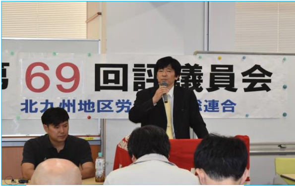
中山地区労連議長のあいさつで開会

解雇・残業代未払い・パワハラ あきらめないで電話して下さい 秘密厳守 相談無料 労働相談ホットライン フリーダイヤル 0120-378-060 soudan@yamaguchiroren.or.jp