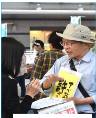
安倍政治を許さない!

倍政権NO!の選挙権行使を呼びかけ歴史的な参議院選挙にふさわしく投票率アップを目指す。③政党支持と政治活動の自由を守るとともに、青年分野の取り組みを特に重視する。18歳選挙権の実現を踏まえ、学習を基礎に、「安倍政権NO!の選挙権行使」を広げ、青年労働者の投票率を大幅にアップさせる。④「統一候補」が実現した選挙区では、その候補の押し上げに全力をあげる。この4つを展開していく視点のもとで、政権与党と補完勢力に痛打を与え、安倍政権を退陣に追い込むために労働運動の総力を結集して全力で取り組むことをすすめていきましょう。