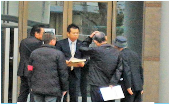
豊留組合員に対するパワハラ行為について抗議の申し入れをしました

北九州地域ユニオンには、連日会社の不当な労働者いじめに苦しんでいる労働者から様々な相談が持ち込まれています。現在、未払い賃金、パワハラで裁判などをたたかっている東洋食品、セクハラ、パワハラ、暴力行為に対して謝罪と慰謝料を求めてたたかっている三菱化学物流、採用後研修も指導もせずに協調性がないと言っただけでなされた不当な解雇とたたかっている協同食鳥の仲間