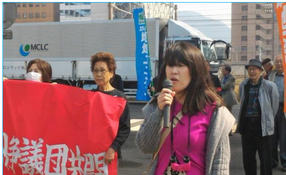
上司によるセクハラ・パワハラは許さないと訴え、必ず勝利判決を勝ち取ると決意を述べる友田組合員