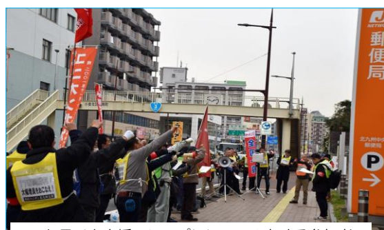
ストライキ支援のシュプレヒコールをする参加者

郵政産業ユニオンは、3月23日北九州中央郵便局で1時間の時限ストを決行し、要求の前進をめざしたたたかいを継続しています。