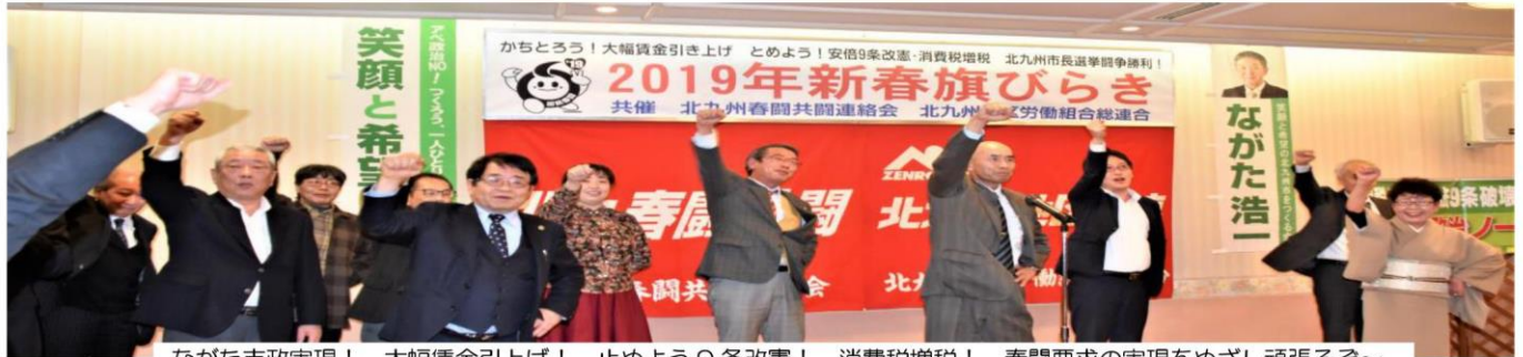
ながた市政実現！、大幅賃金引き上げ！、止めよう9条改憲！、消費税増税！ 春闘要求の実現をめざし頑張るぞ～