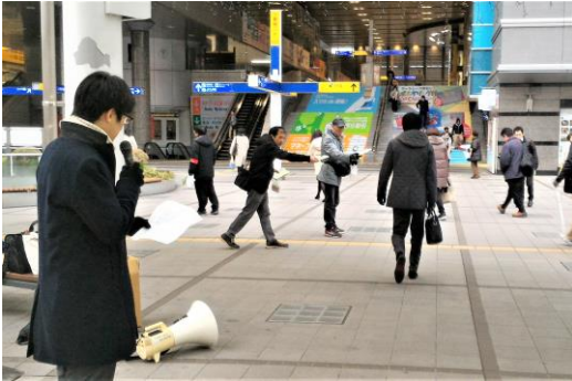
1・10早朝宣伝は市内4つの駅頭で26人が参加 675枚のチラシを配布