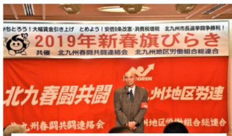
永富北九州春闘共闘、北九州地区労連議長が行いました

1月11日(金)18時15分から小倉北区リーセントホテル玄海の間で、北九州春闘共闘連絡会&北九州地区労連共催 2019年新春旗びらきが開かれ、来賓、参加者、うたごえの仲間など130人を超える参加で大賑わい。楽しいひと時を過ごすことが出来ました。