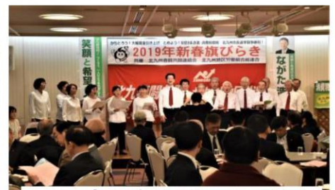
オープニング あら草 希望の歌を熱唱する北九州のうたごえの仲間

1月11日(金)18時15分から小倉北区リーセントホテル玄海の間で、北九州春闘共闘連絡会&北九州地区労連共催 2019年新春旗びらきが開かれ、来賓、参加者、うたごえの仲間など130人を超える参加で大賑わい。楽しいひと時を過ごすことが出来ました。