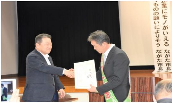
県労連からの推薦状を受け取るながた予定候補