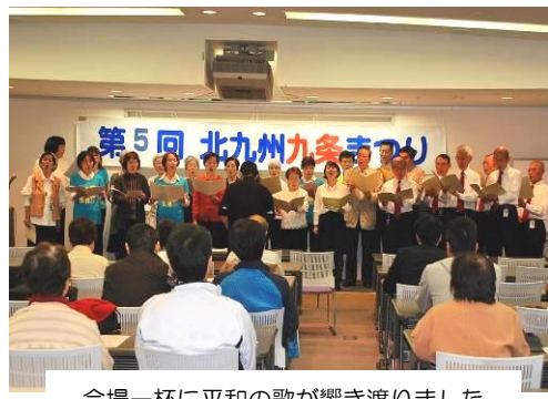
会場一杯に平和の歌が響き渡りました