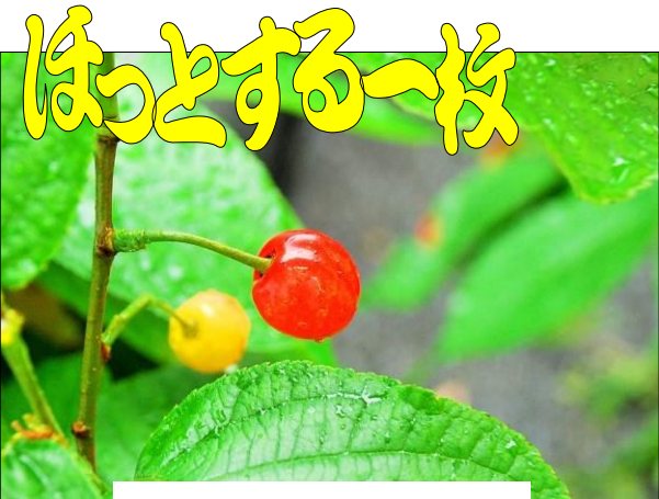
美味しいそうなサクランボ