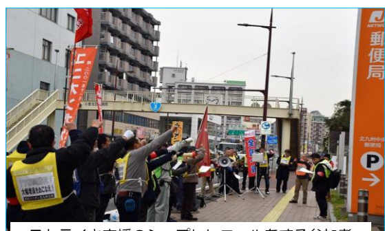
ストライキ支援のシュプレヒコールをする参加者

郵政産業ユニオンは、3月23日北九州中央郵便局で1時間の時限ストを決行し、要求の前進をめざしたたたかいを継続しています。