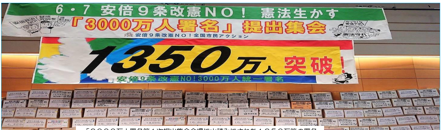
「3000万人署名第1次提出集会会場に山積みされた1350万筆の署名

北九州地区労連の、6月20日(水)現在の到達は、24組合6,405筆です。目標に対する到達は、42.7%です。目標を達成にむけ、平和をあきらめないネットや憲法共同センターなどの行動に積極的に参加しています。