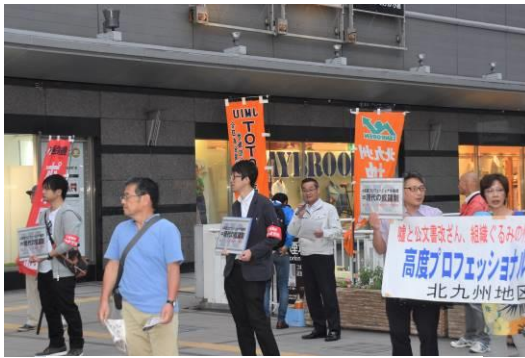
「働き方改革法案」は廃案にせよ！ 北九州地区労連怒りの宣伝行動

怒りー怒りー怒りー怒りの宣伝行動に133団体30人が参加。北九州地区労連は、6月14日(木) 18時15分から小倉駅ペDESTロアンデッキで、「安倍働き方改革法案」の強行を許さず、廃案を求めて宣伝行動を行いました。