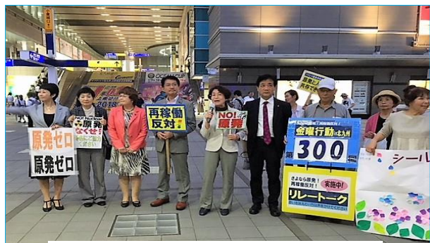
300回目の記念すべき金曜日行動で リレートークをする参加者

原発のない社会が来るま で金曜日行動を続けていきま す。最近に参加が少ないの で、多くの方が参加してい たくよろしくお願いいたします。