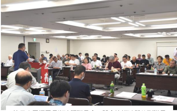
第70回福岡県労連評議員会 開会挨拶は懸谷副議長

議案に対する発言は、7人の評 議員からあり、すべての議案は満 場一致で採択されました。