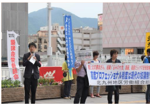
嘘と疑惑まみれのアベ内閣は即時退陣！

過労死ラインを超える残業上限も許されません。上限100時間も問題ですが、月末と月初めに残業を集中させれば月160時間の長時間労働も可能です。まさに過労死合法化法です。労働組合として36協定締結で過労死を始め健康被害を発生させない職場のたたかいも重要です。