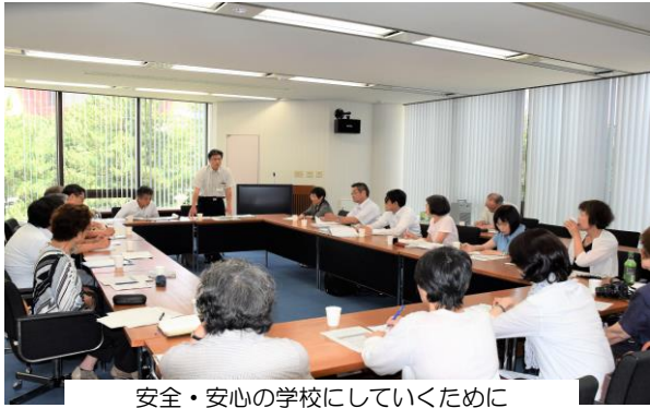
安全・安心の学校にしていくために 教育委員会施設課との懇談会に21人が参加

北九州市公共施設よくする会が昨年8月に取り組み、教育委員会に危険箇所として指摘し改善を求めて、改善申し入れについての回答と、大阪地震で学校のプールのブロック塀が崩落して女子児童が死亡した事故を受け、北九州の学校施設にあるブロック塀の、安全性について調査した件についての報告を受ける懇談と意見交換があり、福建労や北九州地区労連、新日本婦人の会、日本共産党市議など21人が参加しました。