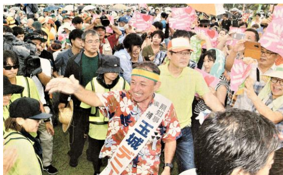
多くの支持者とともに元気に選挙戦をたたかった玉城候補