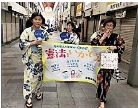
行動終了後記念写真

猛暑でもあり、また、行動時間が遅かったこともあり、アーケードに人がいなかった事は残念でしたが、店主の方とお話ができた、3号線にも出て、バス待ちの人、通りの人、人に配ることができました。横断幕とゆかた姿がやはり目を引き、バスの乗客や車の運転手、反対側の歩道を通っている人などに注目を浴びました。