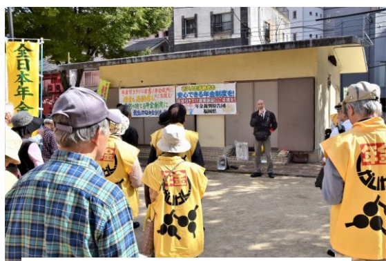
年金一揆北九州集會を激励する永富議長