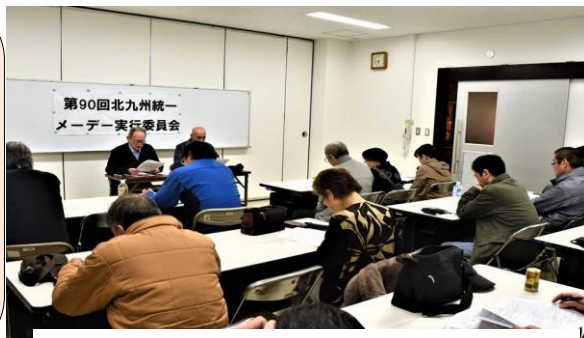
第3回実行委員会に16団体17人が参加しました

連絡先 北九州市小倉北区黄金1-4-9-207号 メール k_roren@ybb.ne.jp 093-921-0747 ホームページ http://www.geocities.jp/k_roren/