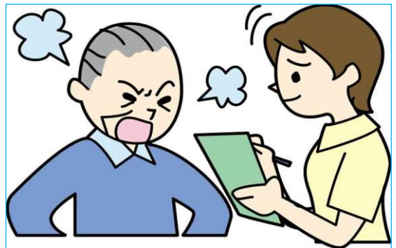
感情労働の冷遇がブラック労働やクレームを呼ぶ！

クレームの内容を聞き出すとともに、今後の対処策を回答することになります。それと同時に相手の不満の矢面に立たされる仕事でもあるため、相手が理不尽に激しい感情になったとしても、これに触発されて労働者の感情をぶつけてしまうと相手方の不満は解消されません。そのような意味においては、コールセンターの労働者は自身の感情を抑えて、相手方の不満を解消することができるといえるように、感情労働に位置づけられます。