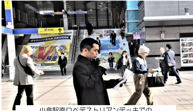
小倉駅南口ペデストリアンデッキでの早朝宣伝 マイク宣伝も行ないました