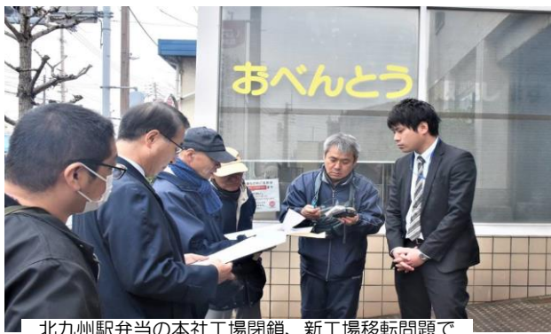
北九州駅弁当の本社工場閉鎖、新工場移転問題で自治労全国一般と共同で申し入れ行動を展開