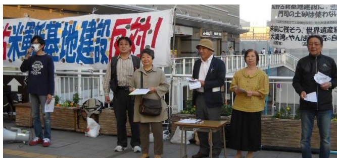
記念写真風に撮ってみました