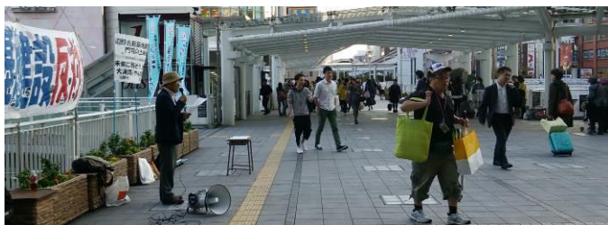
人通りは多いけど、ビラの受け取りが少ない小倉駅前