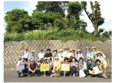
↑ 茶毘志山(チビシマ)古墳の前で