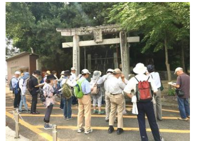
↑ 荒神森(カウソノ)古墳見学の様子

その後JRで下曾根駅へ。前方後円墳を5ヶ所巡りました。うっそうとした木々に守られた荒神森古墳ではしばし静寂に浸り、丸山古墳と円光寺古墳は原形こそ破壊されていましたが、カーブする水路が古墳の裾の輪郭を暗示しています。次は潤崎遺跡でみつけた埴輪窯跡、10号線バイパス脇に保存されている茶毘志山古墳、上山山古墳を見学。「この地域にだけ前方後円墳が存在する」との説明があり、今まで気づかなかったふるさとの古代を垣間見ることができました。これらの古墳は城野遺跡の巨大な方形周溝墓よりかなり時代が下りますが、権力者の様々な想いに浸れる4時間の熱いプチ旅でした。次回のプチ旅も乞うご期待！