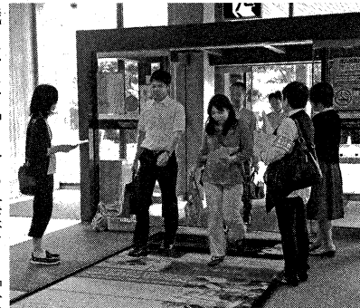
6月1日朝本庁舎アンケート配布

アンケートによると、正規職員の82%、非正規職員の74%の人が働き続けることに不安を感じています。不安の理由は正規