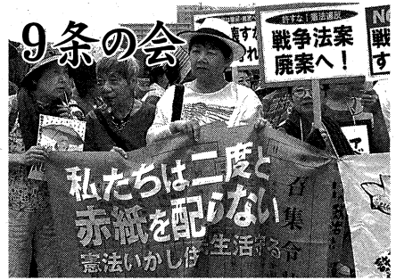
8月30日 女性の集会=リバーウォーク横

9月9日、9条にちなんだ行動が各地で行われていたが、北九州市役所女性9条の会も小倉の鶴外橋で6・9行動を行いました。小雨がちらつく中、核兵器廃絶を訴え、ビジネスマン風の男性や、市役所から退庁してきた職員らが署名に応じてくれました。 「安全保障関連法案」の反対集会やデモが連日各地で開かれています。私たちのこの署名活動も、平和な世界を子ども達に残すため、核兵器がこの地球上からなくなるまで、続けていきます。 署名は5筆で累計293筆になりました。10月は9日金曜日に黒崎駅前で行う予定です。退庁時に少し足を止めてご協力お願いします。