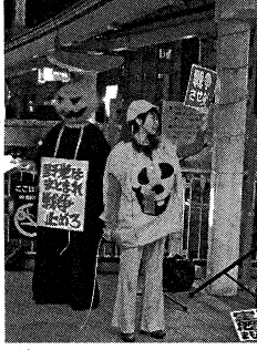
カボチャのお化けも反対 10.19