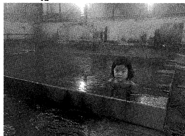
葉っぱの観察力 モミジの観察力 茶褐色の湯の中 に舞っています。 見習わないと。