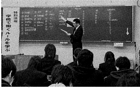
今泉先生による星生学園での模擬授業

教え、どうやったら解決できるかを理解できるように、労働法を教えるだけでなく、労働組合を学ぶことが必要で、