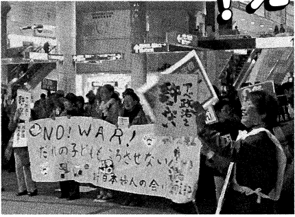
女性団体も「戦争法」廃止への声を上げる 11・19

したが、治安維持や「駆けつけ警護」では敵対勢力との戦闘行為で自衛隊員にも「戦死者」が予想されています。 そのため、武器使用の訓練を強化したり、自衛隊員が戦死した場合を考慮して弔慰金を9000万円に引き上げるなど「戦死者」と家族への対応を強化しようとしています。