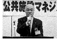
出前講演する市担当者

11月、市は今後40年で公共施設の20%（床面積）以上を削減する公共施設マネジメント素案を発表しました。