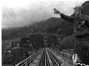
運転手さん曰く、岩戸の景色を心に残して、とのことだが、シャボン玉が一番印象に。

明けましておめでとうございませう。今年も拙い文章にお付き合いの程よろしくお願ひいたします。