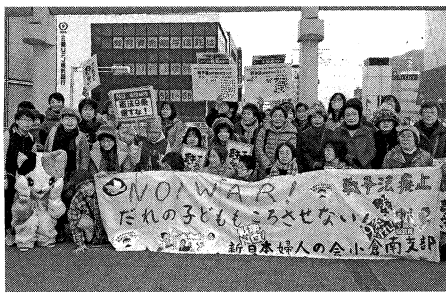
戦争法反対! あきらめないぞ!

たかかわれます。 戦争法廃止を求めて、共同の力を発揮させた「総がかり行動実行委員会」は運動の継続を決め、二〇〇〇万筆を目標にした「戦争法廃止統一署名(以下、「統一署名」)を呼びかけています。そしてこの呼びかけに、「戦争法反対」のたたか