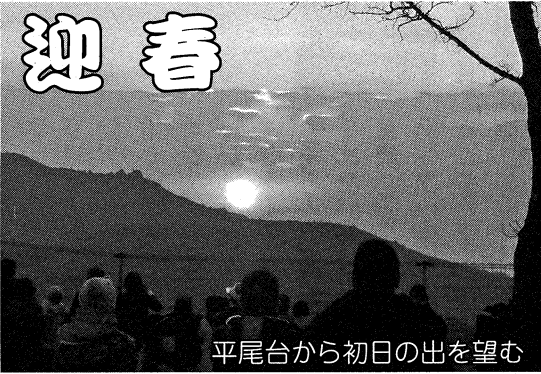
平尾台から初日の出を望む

自治労連北九州市職員労働組合 編集発行 重野 幸介 北九州市小倉北区内1番1号 TEL 093-582-4181 FAX 582-4183 Eメール jhokuq@jhokuq.jp