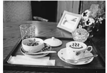
たまにはこげな写真。震湯カ フェ内蔵丞にて。最後まで逆 さくらゲをキープできるかな。

ところ 島根県大田市温泉津町温泉津口208-1 温泉津温泉「元湯」 ☎0855-65-2052