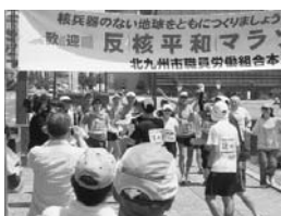
昨年の平和マラソン