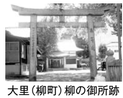
大里（柳町）柳の御所跡

抗争も木曾義仲に敗れ、寿永2年（1183年）平氏一門は安徳天皇（清盛の外孫）を擁して「都落ち」し九州大宰府に入っています。2ヶ月後の10月20日には豊後の緒方惟義が攻撃をかけた為、大宰府を捨て蘆屋浦の山鹿城に入ります。ついで豊前柳ヶ浦（門司区大里）に移ります。大里には「柳の御所跡」などの史跡があり、大里の地名も内裏（だいら）からきています。一時的にせよ内裏（未完成）の地と定めたのは、門司関に近く関門海峡に面した磯は船着きがよく古代官道（駅路）も通り背後の戸ノ上山山系に囲まれた地形の良さが考えられます。