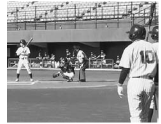
昨年の九州大会予選の様子

9月21日(土)に、第31回全国自治体軟式野球九州予選大会が長崎で行われます。優勝チームは10月18日(日)に愛媛で行われる全国大会に出場します。 昨年の九州予選大会では、一昨年全国優勝した強豪長崎市を決勝で破り、十数年ぶりに優勝しました。 また、全国大会では、九州代表として参加し、念願の初勝利を収めました。選手一同2連覇に向けて張り切っていますので、是非応援のほどよろしく願います。