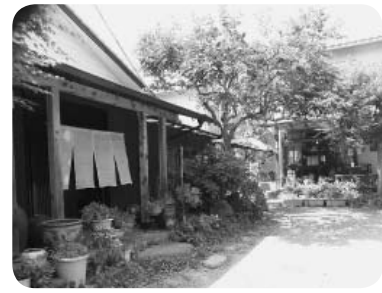
隠れ家的なお店でした

ラリーマンを定年退職し、奥さんに喫茶店をしたらと言われ、自宅の離れで喫茶店を始めました。どうしたらお客さんが来てくれて、住んでいる町が活性化できるのかを考え、喫茶店でお茶をすると、自宅の温泉に無料で入れるようにしました。全国各地に行ってもそういう温泉場はないと、テレビ朝の「人生の楽園」で8年ほど前に取材を受け、放映後は全国の方がたくさん訪れる様になったそうです。