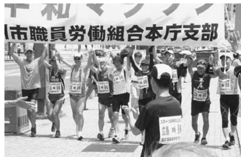
市役所前の中継地点

3回目の参加という大阪府在住の女性ランナーは、「初めて参加した時に、沿道の応援、中継地点での接待、そしてなにより反核平和を訴えて走る事に魅了されました。」とお話されました。