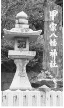
当時の門司関が現在の「税関」と「海上保安庁」の役割を担っていたと考えられるので、兵船70余艘を率いて親房が門司関に下向したと思われる。

親房を「門司氏」の姓祖とする「門司氏系図」によれば、親房は相州(時頼)御教書を携帯して船70余艘で門司関に着任し、建長七年(1255年)に門司関領六所香椎院内等を拝領したとあります。門司氏系図によれば、門司関に下向した親房の父「季公」の実父は藤原師公(陸奥守)、養父中原親能(鎌倉幕府の重鎮大江広元と兄弟)で門司氏の祖とされています。