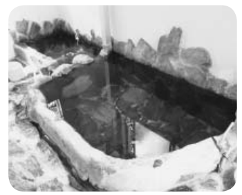
肌に優しい美人の湯