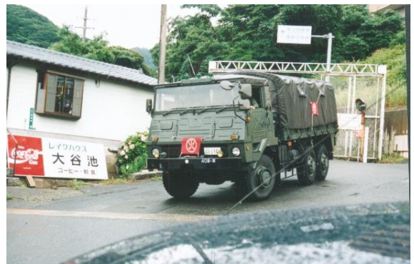
「火」のマークを付けた自衛隊のトラックで弾薬を搬出