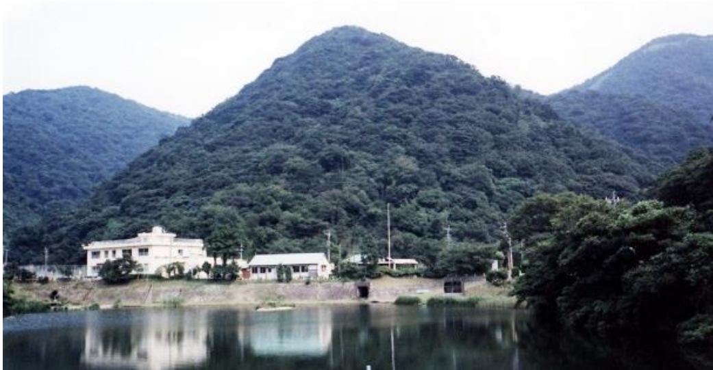
富野弾薬庫の写真。山(丸山)をくりぬいて 13 本のトンネル式の弾薬庫を建設。面積 1,667,088 m 2 で、危険度「1」の表示が 5 本ある。