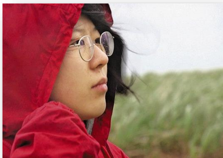
映画のワンシーン

50年近くいろんな運動に関わり、「敗者」になることの方が圧倒的に多かったけれど、それにも大きな意味があったのだと気づかされました。心に希望が灯る映画でした。(やつきくみこ)