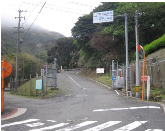
富野弾薬庫の入口

弾薬の搬出・搬入は、繁華街や住宅街、通学路を使用しています。自衛隊は「信管を外しているから安全」と言いますが、交通事故など安全である保証はありません。また、富野弾薬庫の真下には、小倉東断層が