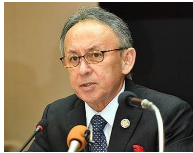
不承認の回答をする、 玉城デニー知事