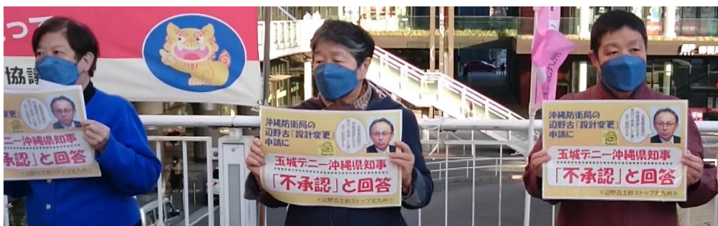
ブルーアクションの様子

たたかいは続きますが、全国のみなさんと力を合わせ、辺野古新基地建設ストップまで、頑張りましょう。