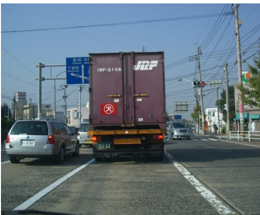
市街地を走る弾薬を積んだトラック