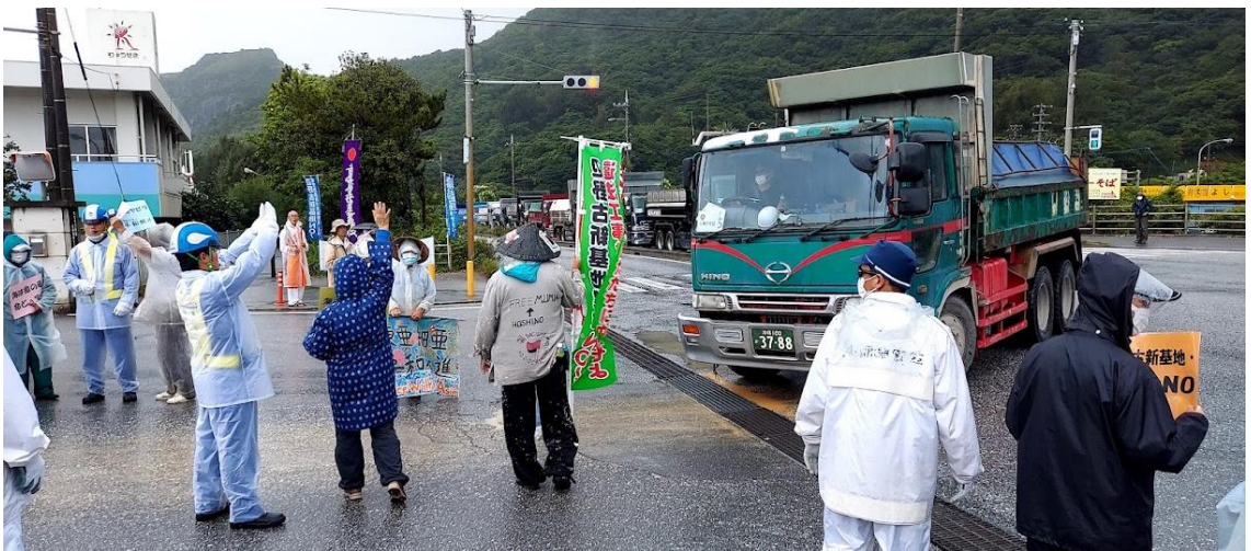
安和栈橋入口の様子

大好きな沖縄ですが、コロナの流行以来、行くのを遠慮していました。でも、今回は現地からの呼びかけなので堂々と行きました。確かにきつい行動です。でも、安和から歩いて30分の所に宿をとっていたので、抗議の人数の多い昼時は宿に帰って休み、朝の開始から昼前までと、