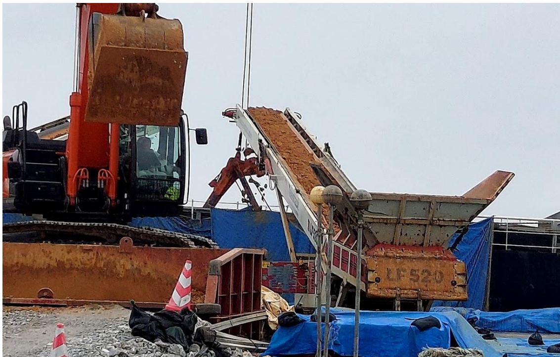
塩川港の様子。ダンプが運んできた土砂(この日は赤土)は、ベルトコンベアで船に積み込まれる。