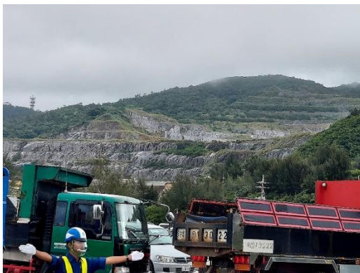
塩川港の様子。後ろに採石場の一部が見える