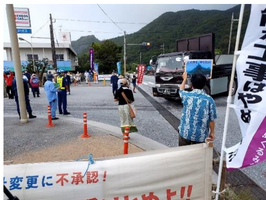
安和棧橋入口の様子

でも、こんな平和な時間は長くは続きません。8時半過ぎ、これまでの右折車両に加え、反対方向から左折して入ってくるダンプが表れ始めると、機動隊も出てきて混乱し始めます。