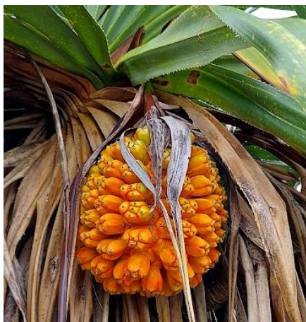
美しい色のアダンの実