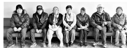
陳情審査の傍聴に参加した皆さん