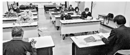
保護課との懇談風景

住民税非課税世帯への 5 万円の給付金の家計急変世帯について、生健会が「今年になって生活保護を開始した方については保護課しか把握してない。保護課からフォローすべきだ」と