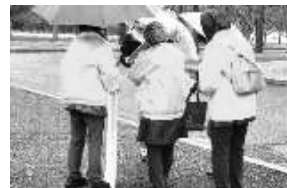
昨年12月に計画し、雨で中止したグリーンパークでリベンジ行動。またも雨ですが「雨にも負けず」16人が署名してくれました。「学校でチラシ見たよ」や「それ署名しましたよ」などうれしい声も。

八幡西地区は折尾駅前前で宣伝4時頃から行動。30分で64筆。楽しく賑やかにがモットーです。自信にもつながり、給食効果だなあ。若松作成のプラスター効果抜群!