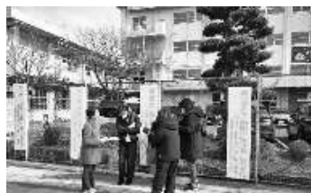
江川小学校前で「給食費は16万弱払ったかな?」「ありがとうございます」「ご苦労様」と声をかけられました。5人参加で16筆。

八幡西地区は折尾駅前前で宣伝4時頃から行動。30分で64筆。楽しく賑やかにがモットーです。自信にもつながり、給食効果だなあ。若松作成のプラスター効果抜群!