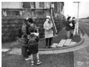
洞北中で。皆さん気持ちよく署名してくれて、「3年以内になったらいいな」6人参加で56筆

「若松地区の大奮闘ぶり。小中学校の入学説明会に宣伝署名行動に出かけました。「この場所なら車を停めて歩いてくるよ」の情報をもらって待機。手作りの黄色の看板が目立ちました。」