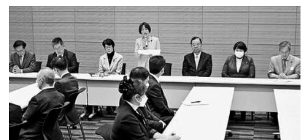
(写真) 議員団総会であいさつする田村智子委員長 = 26日、衆院第1議員会館

第213通常国会が26日、召集されました。会期は6月23日までの150日間です。