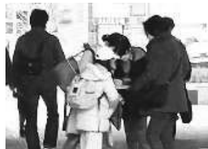
子ども連れの方が次々と署名!