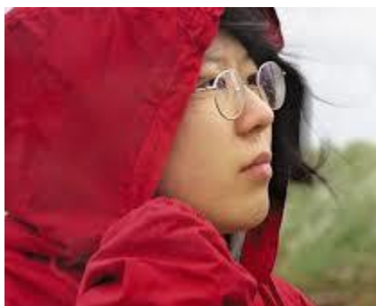
映画のワンシーンの菜の花さん