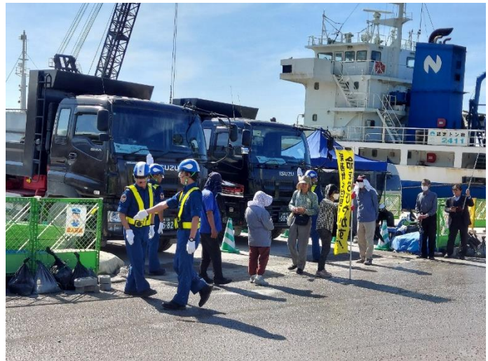
午後2時頃、各地からの応援で、抗議行動の人がも増える

でも、抗議行動の人数が少ないと、離島向けに紛れて、多くのダンプを素通りさせてしまうことになる。とにかく、塩川は人の数が成果に直結するので、たくさんの応援が必要だ。