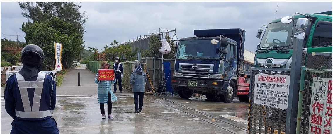
安和棧橋出口での牛歩行動

更に、港を出るときの経路が、本来辺野古向けと離島向けでは別になっているのに、離島向けに紛れて牛歩を避け、早く港を出られるように、警備員がわざと離島向けの経路に辺野古向けのダンプを誘導する。抗議行動の人数が多いと、港の奥に人を配置して、