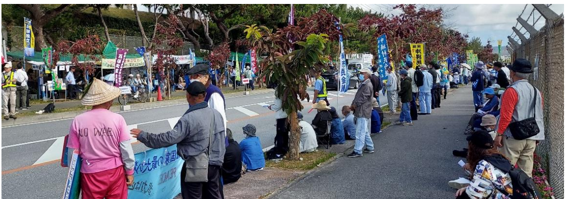
キャンプシュワブゲート前での県民大行動の様子

2月3日は、安和も塩川も作業の無い土曜日だったので、辺野古のキャンプシュワブゲート前で行われた県民大行動に参加した。大浦湾側の工事開始直後の1月12日に行われた県民集会には、主催者が想定した倍近くの900人が集まったという。この日も850人が参加していた。埋め立てへの怒りのエネルギーを感じる。また、さすが沖縄だと思うのは、玉城知事がフィリピンに出張しているため、副知事が参加してメッセージ