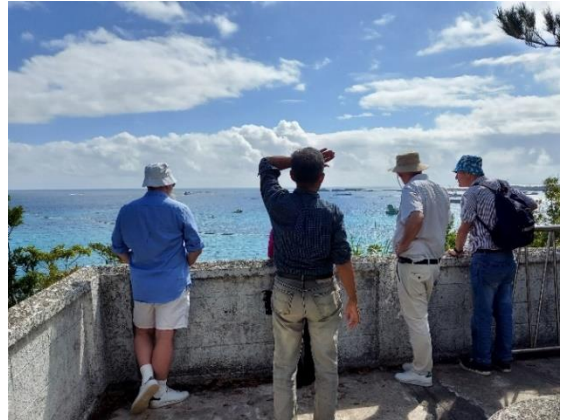
スウェーデンから来た学者を案内して、大浦湾の工事の状況を視察

石材を投入しているケーソンが間近に見えた。天気が良かったので大浦湾がいつも美しかったが、工事の様子が痛々しい。辺野古の埋め立ては世界が憂慮している。