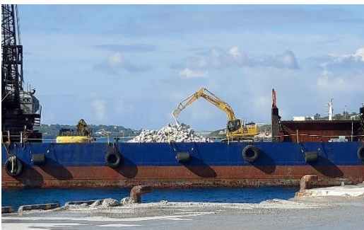
大浦湾に投げ込まれる予定の石材を積み込む