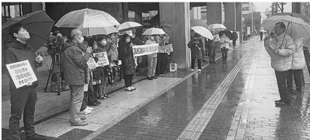
「高松港を軍港にするな」と、県庁前で抗議行動をする「明るい民主県政をきずく会香川県連絡会」のみなさん

また、高知港・須崎港・宿毛湾港が候補となっている高知県や、高松港が候補となっている香川県では、「指定されても同意しないよう」県に求める動きが広がっています。