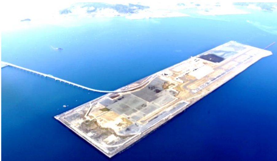
海上に浮かぶ北九州空港

工事が始まれば、滑走路が長くなるだけでなく、いずれ戦闘機や輸送機による離着陸訓練が始まることにもなる。