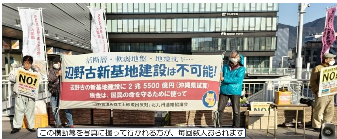
この横断幕を写真に撮って行かれる方が、毎回数人おられます