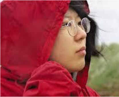
映画のワンシーンの菜の花さん